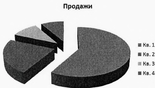
Рис. 1.1. Название рисунка (схема взаимодействия, график, динамика развития и т.д.)